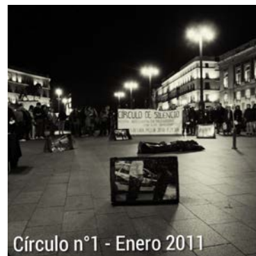
Círculo n°1 - Enero 2011

Círculo del Silencio número 100 de Madrid 5 de Abril. Puerta del Sol- Madrid. 20:30 h.