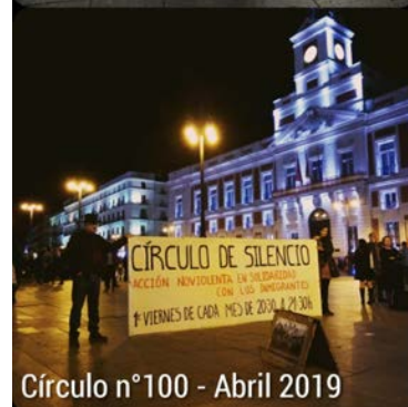
Círculo n°100 - Abril 2019